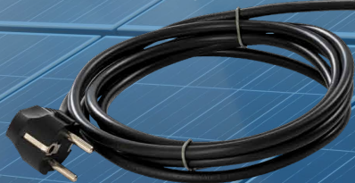
Einschraubheizkörper 3 kW